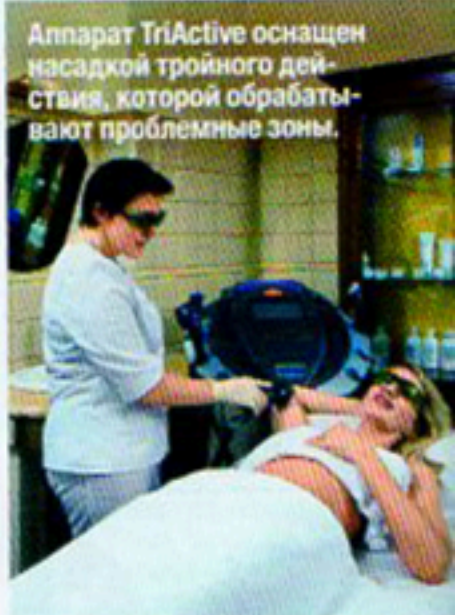
Аппарат TriActive оснащен насадкой тройного действия, которой обрабатывают проблемные зоны.

«ушек» на бедрах и проявлений целлюлита целый комплекс процедур. Сначала соляной пилинг и обертывание с экстрактами водорослей: бурых (восстанавливают минеральный баланс в тканях и выводят токсины) и зеленых (расщепляют жир). Обертывание в течение 25 минут проходило под инфракрасной лампой – чтобы я сильнее потела. Затем мне сделали 15-минутный массаж аппаратом TriActive с насадкой тройного действия. Ультразвук разрушает жировые клетки. Лазер усиливает микроциркуляцию крови и обменные процессы – от притока кислорода жир быстрее окисляется и выводится из организма. А радиоволновое